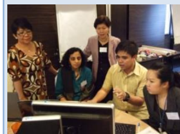
Participantes en talleres recientes